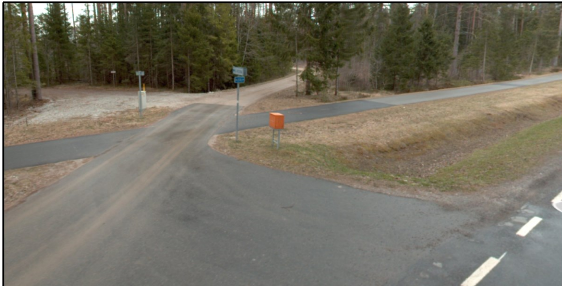
Joonis 1. Väljavõtte teevideost (aprill 2023)