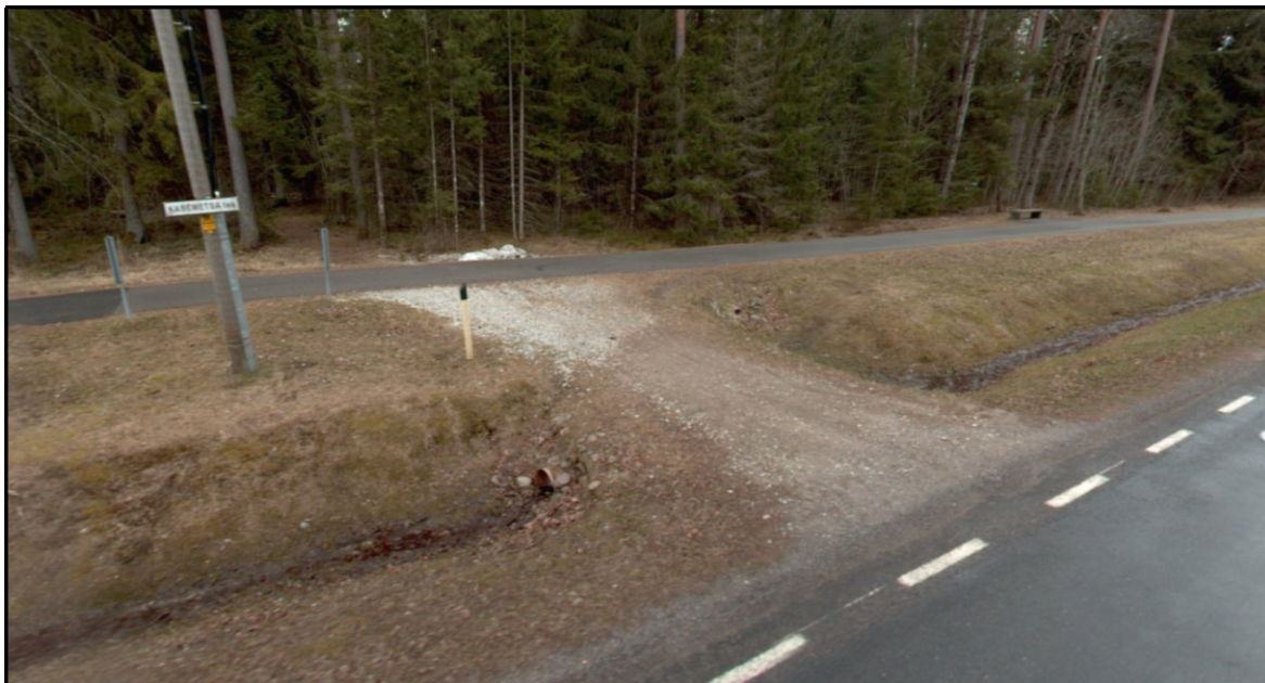
Joonis 3. Väljavõte teevideost (aprill 2023)

Sarnaselt olemasolevatele ristumiskohtadele (vt joonis 1 ja 2 ) tuleb nimetatud ristumiskoht ümber projekteerida (vt joonis 3 ) vastavalt EhS § 99 lg 3 alusel antavatele riigitee ristumiskoha ehitamise nõuetele (vt Lisa 1 ). Ristumiskoht peab olema välja ehitatud ja Transpordiametile üle antud enne kinnistule mistahes hoonete ehitamise alustamise teatise esitamist.