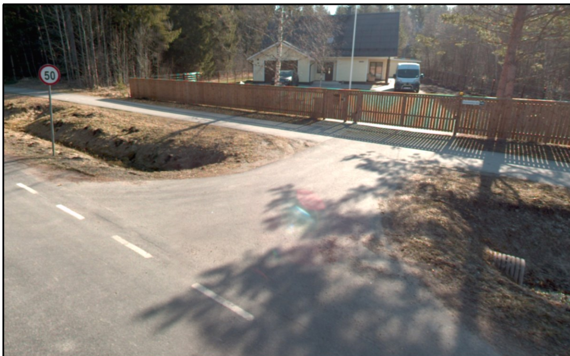
Joonis 2. Väljavõtte teevideost (aprill 2023)

Kuna Metsa-Rännaku kinnistuga piirnevale kohalikule Kasemetsa kergliiklusteele nr 7185020 on tagatud juurdepääs riigiteelt ca km 1,577, siis on sobiv nimetatud ristumiskoha kaudu tagada juurdepääs ka Metsa-Rännaku kinnistule (vt joonis 3 ).